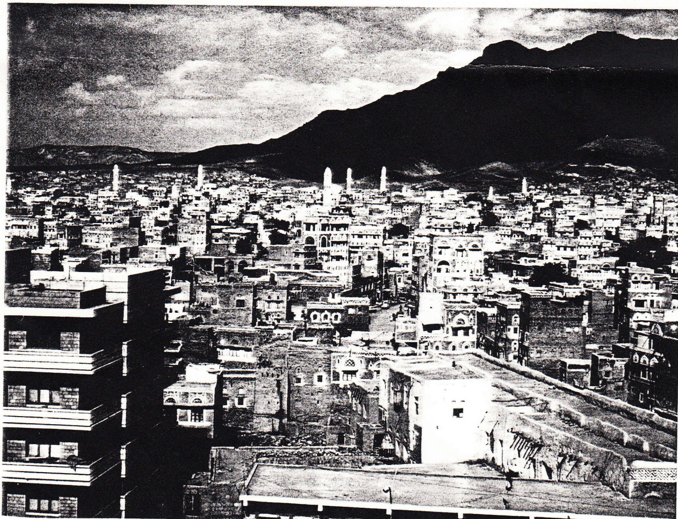
Vue de Sana'a